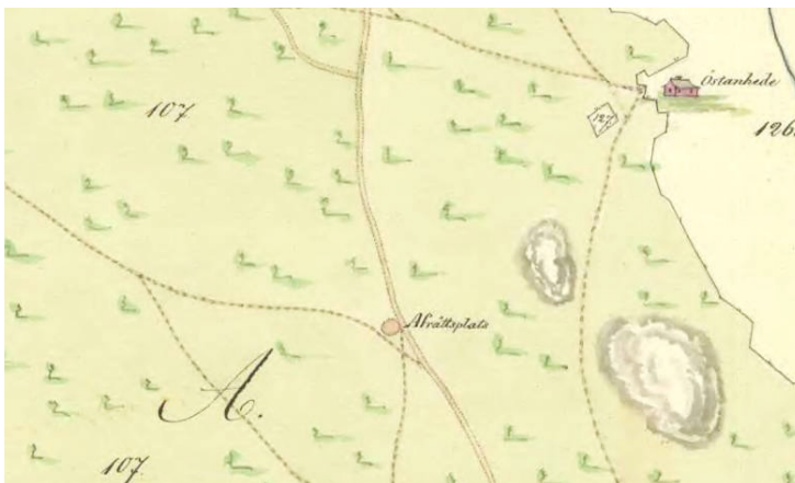
Kuva 4. Teiden risteykseen merkitty rangaistuspaikka Gävlen lähellä sijaitsevan Torsåkerin kartassa vuodelta 1815 (Lantmäteriverkets forskningsarkiv, Gävle; Karta V51-9:1 (1815) Torsåker, Gammelstilla Bruk).

Varhaismodernista Skandinaviasta ja Länsi-Euroopasta tunnetaan myös tapa käyttää teloituspaikeina esikristillisiä kalmistoja ja käytöstä jääneitä hautapaikko-